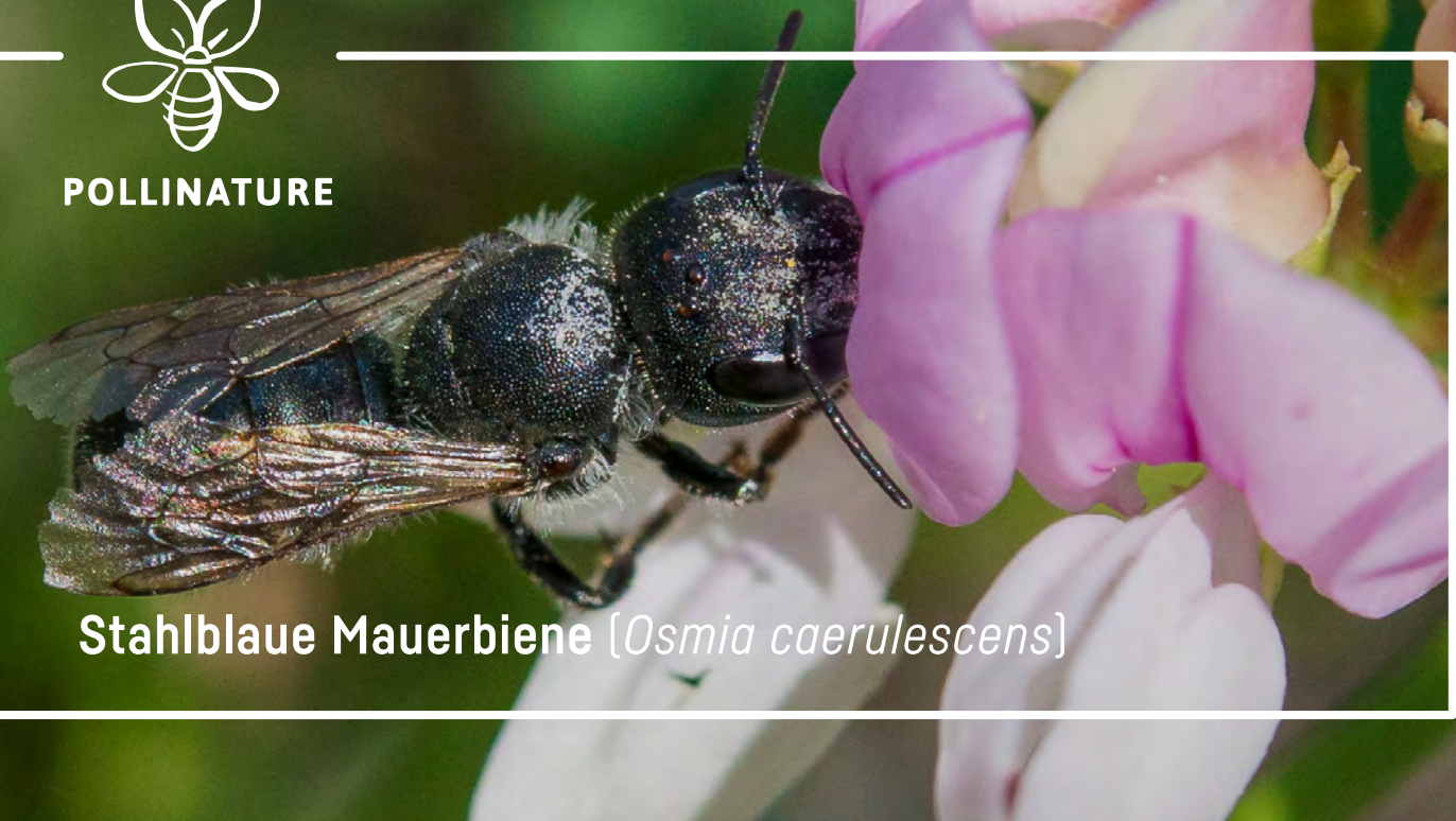
Stahlblaue Mauerbiene [ Osmia caerulescens ]